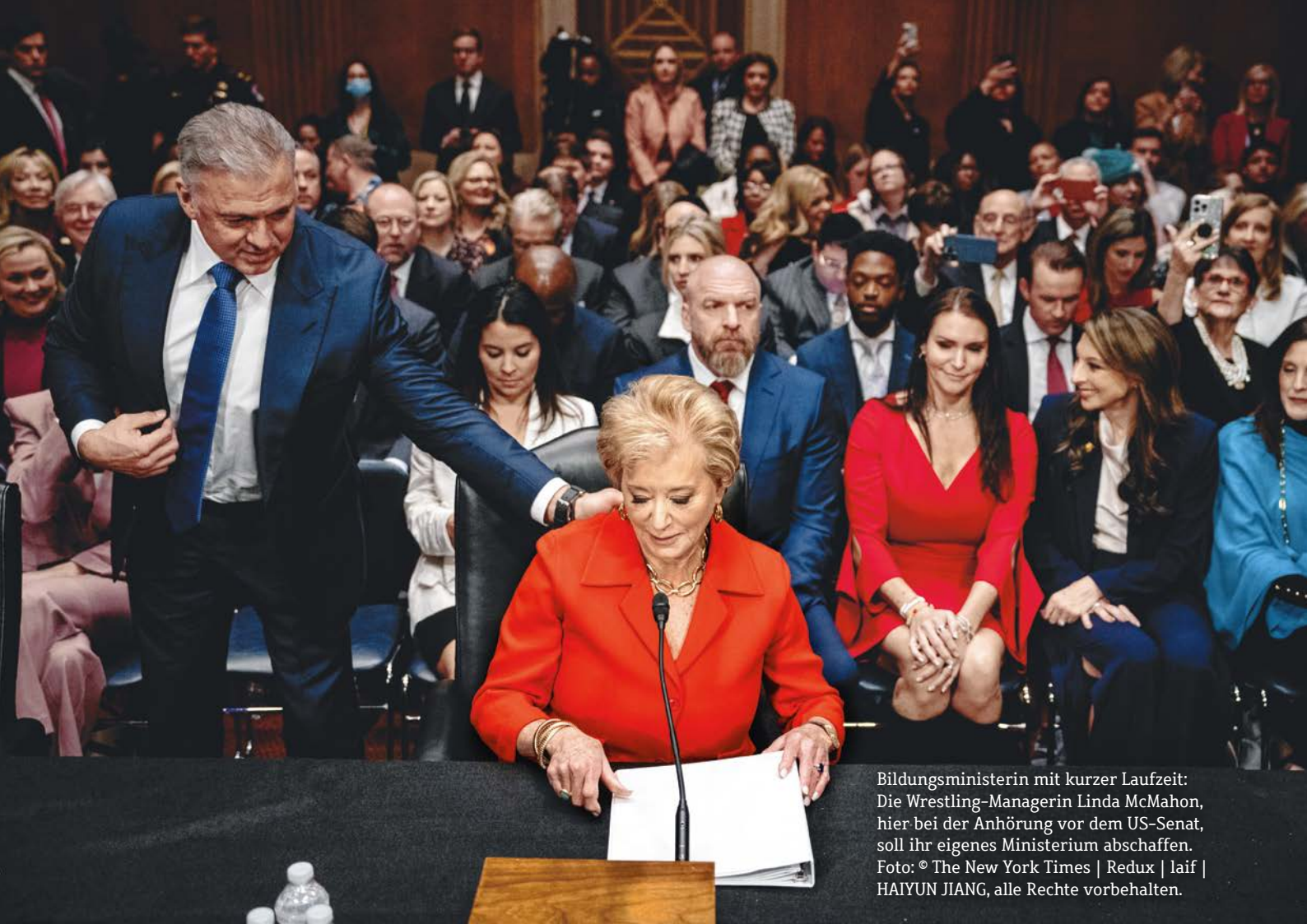
Bildungsministerin mit kurzer Laufzeit: Die Wrestling-Managerin Linda McMahon, hier bei der Anhörung vor dem US-Senat, soll ihr eigenes Ministerium abschaffen.

und die Gesellschaft insgesamt noch wichtiger; vermehrt gab es Maßnahmen zur Verbesserung der Bildung für historisch marginalisierte Gruppen. Es mag umstritten sein, ob diese Veränderungen tatsächlich zu mehr Gleichheit geführt haben. Der entscheidende Punkt ist aber, dass in einer liberalen Weltordnung Bildung einen hohen Wert und eine große Legitimität hat.