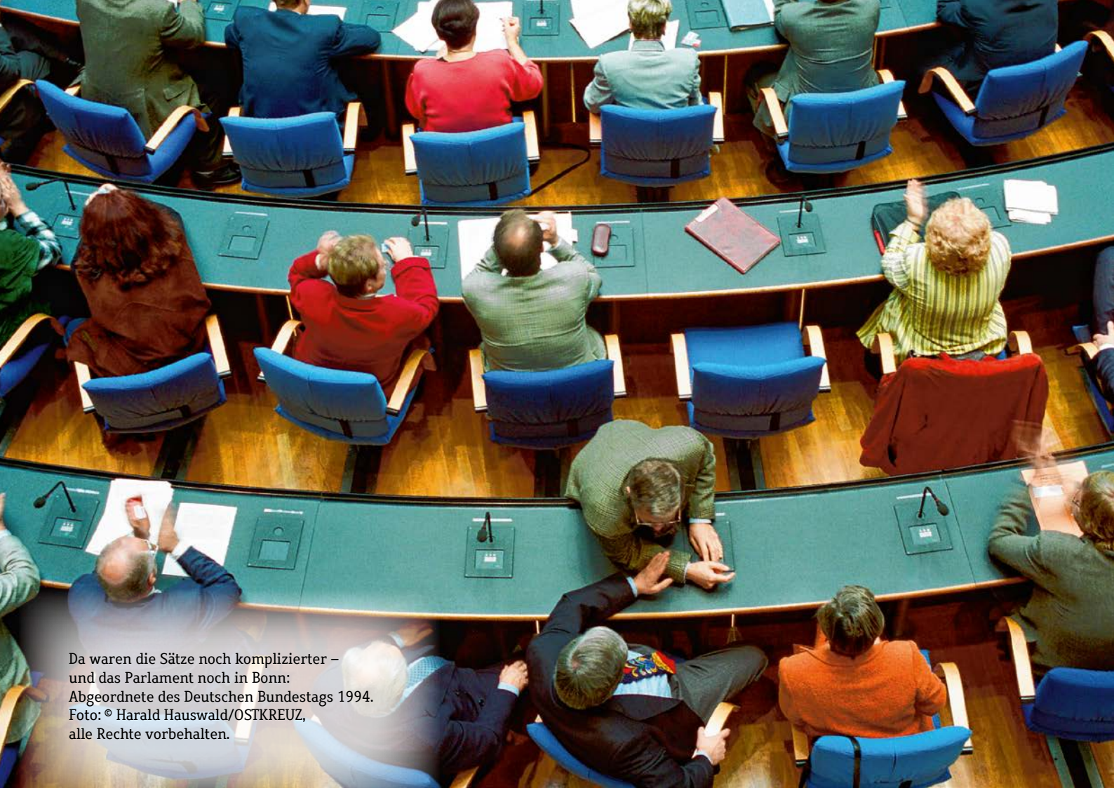
Da waren die Sätze noch komplizierter – und das Parlament noch in Bonn: Abgeordnete des Deutschen Bundestags 1994.

Konzepten argumentieren. Es wird lediglich die Satzstruktur und deren Komplexität analysiert. Populistinnen und Populisten mögen also nicht unbedingt grammatikalisch und sprachlich betrachtet einfache Sprache benutzen, trotzdem argumentieren sie oft mit einfachen Lösungsvorschlägen und Ideen. Das kann dazu führen, dass ihnen eine einfache Sprache als Merkmal zugeschrieben wird, wobei es eher die Inhalte sind, die eine vereinfachte Welt darstellen.