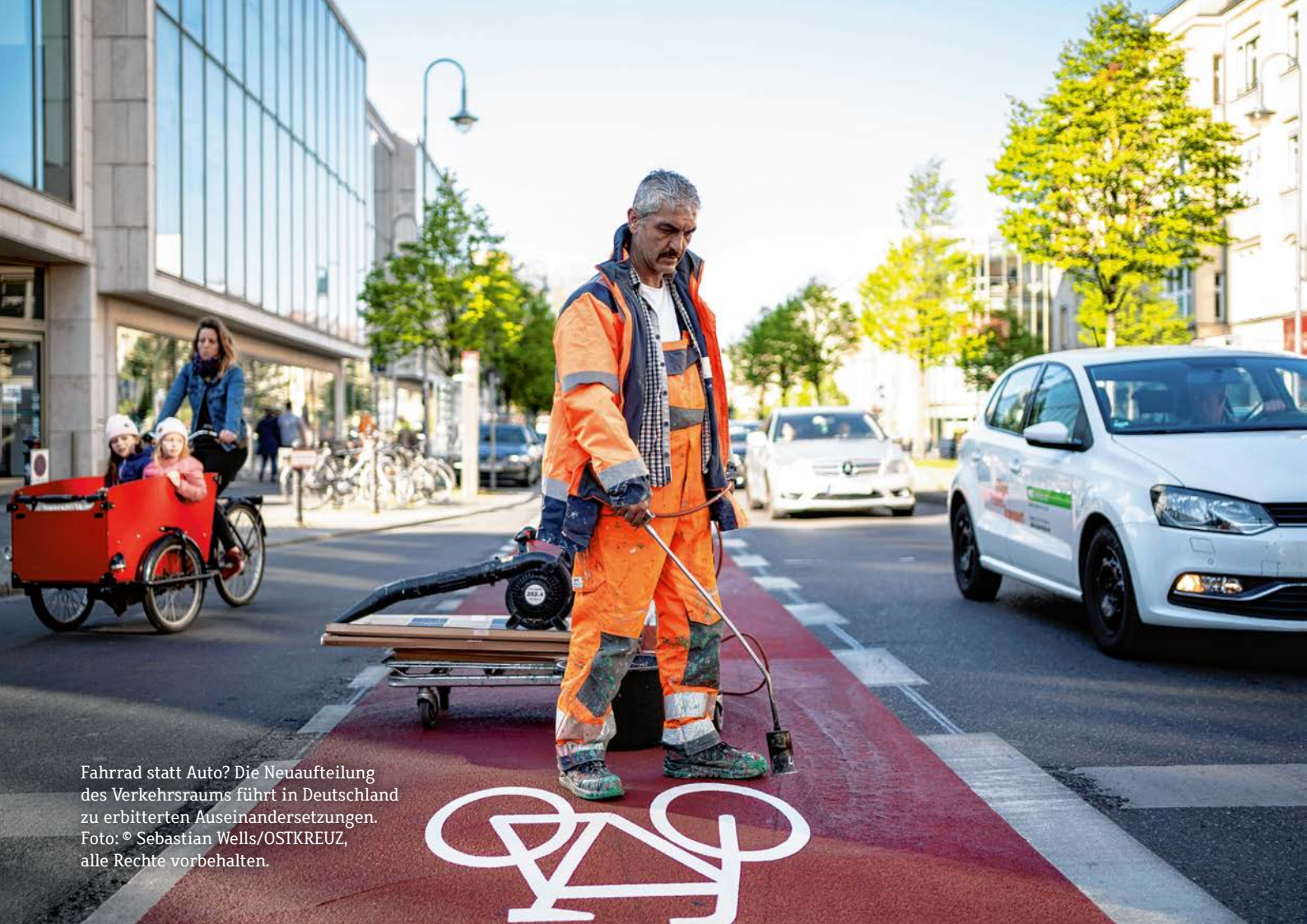
Fahrrad statt Auto? Die Neuaufteilung des Verkehrsraums führt in Deutschland zu erbitterten Auseinandersetzungen.

Die manchmal bis zum Kulturkampf aufgeputschten öffentlichen Auseinandersetzungen um das Autofahren sind wie alle diskursiven Deutungskämpfe das Ergebnis der Problematisierung einer ehemals nicht hinterfragten kollektiven Selbstverständlichkeit. Jahrzehntlang waren das private Auto und das Autofahren kein Problem, niemand musste sich rechtfertigen, es war kein Thema. Das hat sich geändert, die gesellschaftliche Praxis und die Lebensstile sind vielfältiger als zu Beginn der Massenautomobilisierung. Individuelles Verkehrshandeln ist wie andere Konsum- und Stilmuster Ausdruck sozialer Distinktion und bisweilen sogar individueller Identitäten geworden.